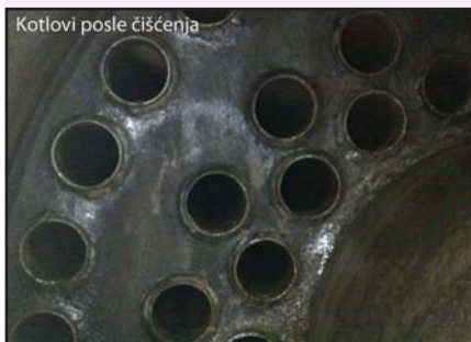
Kotlovi posle čišćenja

Rezultat dejstva je otpadanje naslaga čađi zbog težine, odnosno, moguće ih je sa lakoćom odstraniti pomoću grebalice ili na neki drugi način.