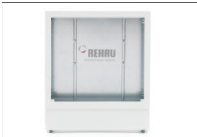
Sl. 6-3 REHAU razdelni ormarić UP (bez vrata)

Razdelni orman UP 110 je namenjen za ugradnju u zid. Podesiv je po visini i po dubini. Bočni zidovi imaju fabričke perforacije za razvodni povratni vod, po želji sa desne ili leve strane. Zaokretna cev koja služi za bezbedno vođenje cevi u priključnom delu je podesiva i demontažna. Podesiva završna maska za estrih obezbeđuje prilagođavanje na završenu površinu poda.