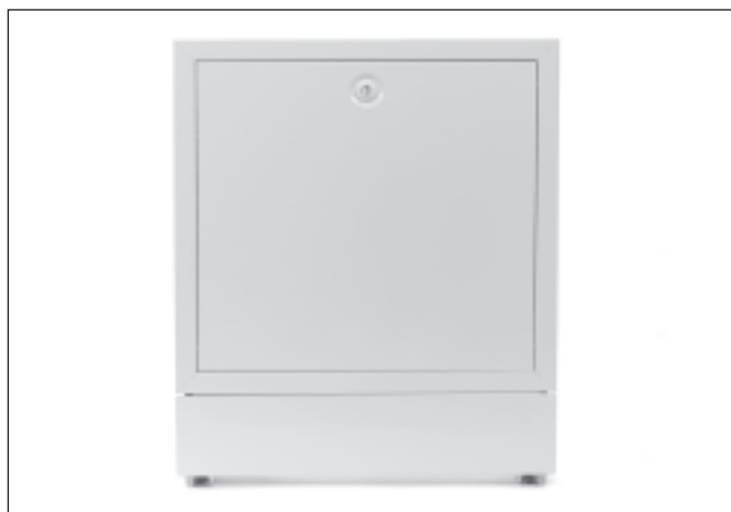
Sl. 6-4 REHAU Razvodni orman UP (bez vrata)

Materijal: pocinkovani čelični lim, sve vidljive površine lakirane u belo (slično RAL 9016)